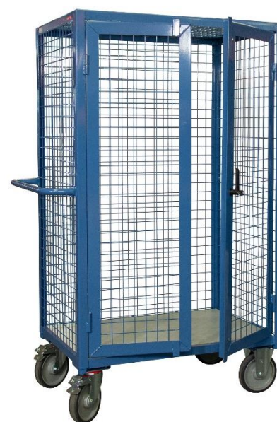
Modèle 3 côtés + portes