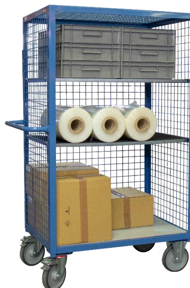
Modèle 3 côtés avec 2 options étagères